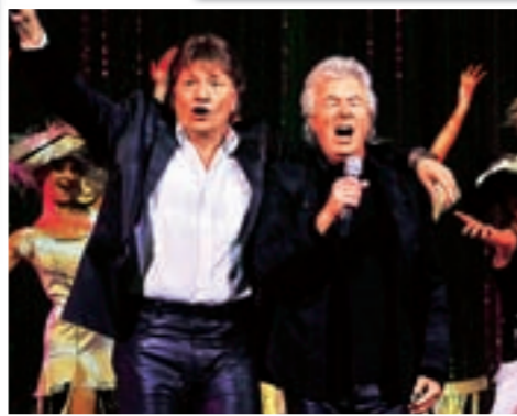
Andreas Holm (l.) und Kollege Thomas Lück stimmen gemeinsam ein Loblied auf den Jubilar an