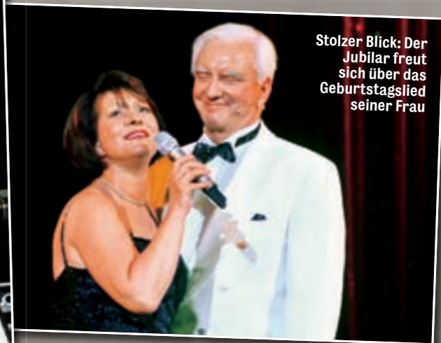
Stolzer Blick: Der Jubilar freut sich über das Geburtstagslied seiner Frau